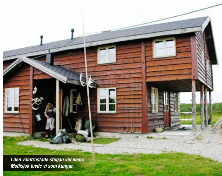
I den välutrustade stugan vid nedre Mollisjok levde vi som kungar.