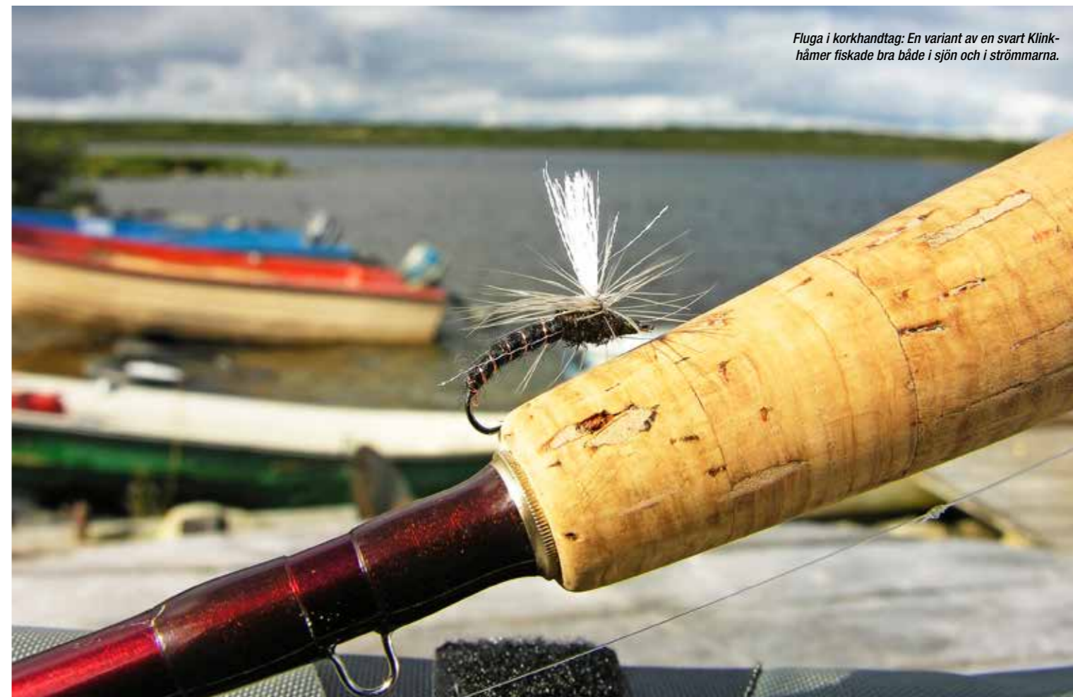
Fluga i korkhandtag: En variant av en svart Klinkhåmer fiskade bra både i sjön och i strömmarna.

Nästa morgon vaknar vi till en klarblå himmel och strålende solsken, vädret varierar snabbt på dessa breddgrader.